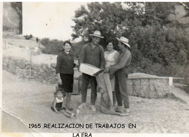
1965 .REALIZACION DE TRABAJOS EN LA ERA

Junto a policía local, todos los días excepto martes.