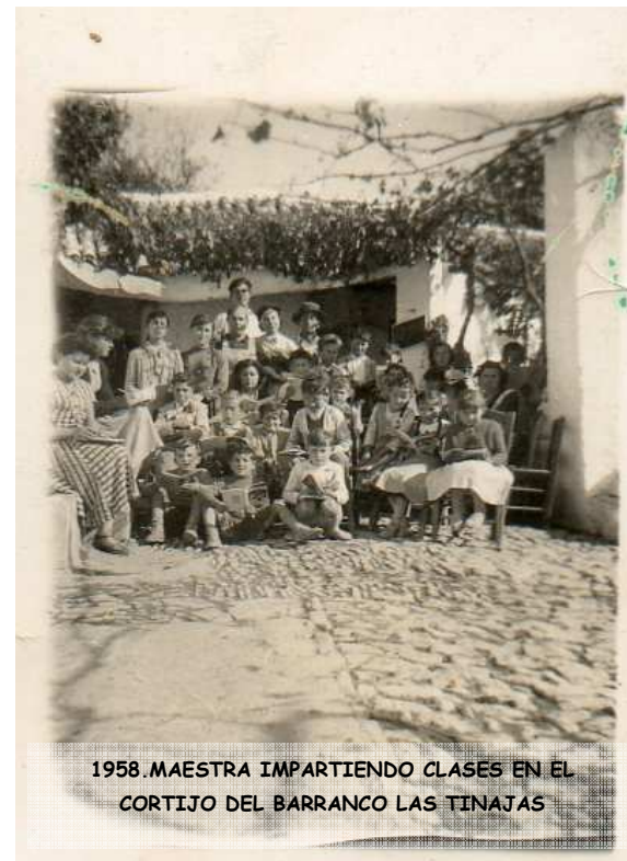
1958 .MAESTRA IMPARTIENDO CLASES EN EL CORTIJO DEL BARRANCO LAS TINAJAS