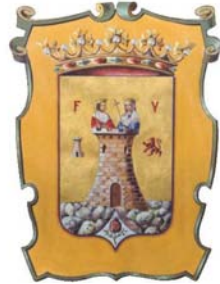
Ayuntamiento de Montefrío

- Seguido del Trío Primavera y una actuación de Copla.